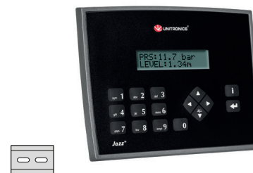
fig. 1. Abmessungen (mm)