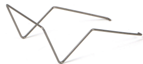
fig. 1. Montage